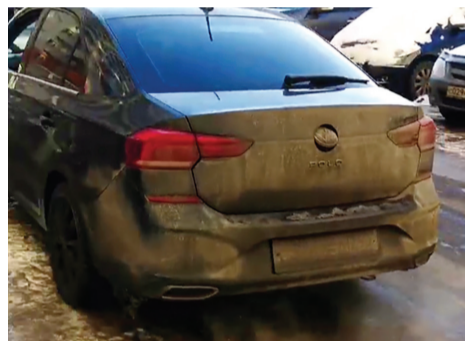
Комментарий к фото 2:

Хочется надеяться, что хозяин этой машины впредь будет думать не только о себе.