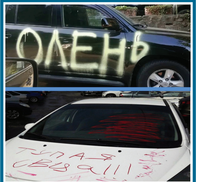
АЛЬТЕРНАТИВА НЕ ДЛЯ НАС

Уважаемые читатели! Если вы пострадали от блокировки вашей машины автохамом или увидели автомобиль, стоящий на пешеходной зоне, зафиксируйте это на вашем смартфоне и разместите фото в чате WhatsApp.