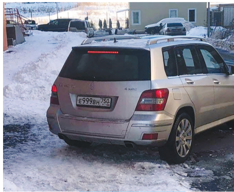
Комментарий к фото 3:

Владелец этого невымытого Фольксвагена Поло чемпион по хамству. Наехал на жителя, проезжает под «кирпич», ведёт себя агрессивно. К тому же у него «левый» пропуск. Конечно, ему не место в нашем ЖК.