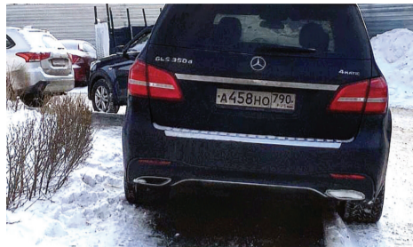
Комментарий к фото 1:

Но есть и те, кто не соблюдает элементарную вежливость. Есть случаи, когда автовладелец игнорировал телефонный звонок. Бывает, автомобиль ставят на тротуар, создавая для мам с колясками и пожилых соседей большое неудобство.